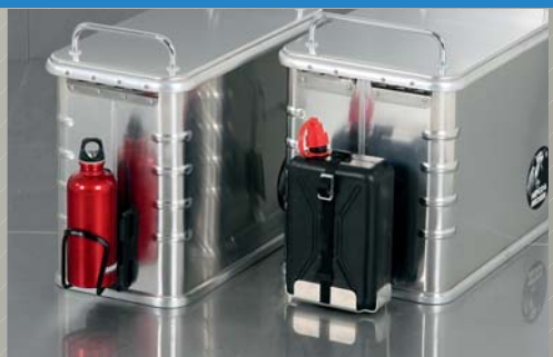
Abbildung zeigt Sonderzubehör Tankset rechts und Flaschenhalter links (Flasche nicht im Lieferumfang)